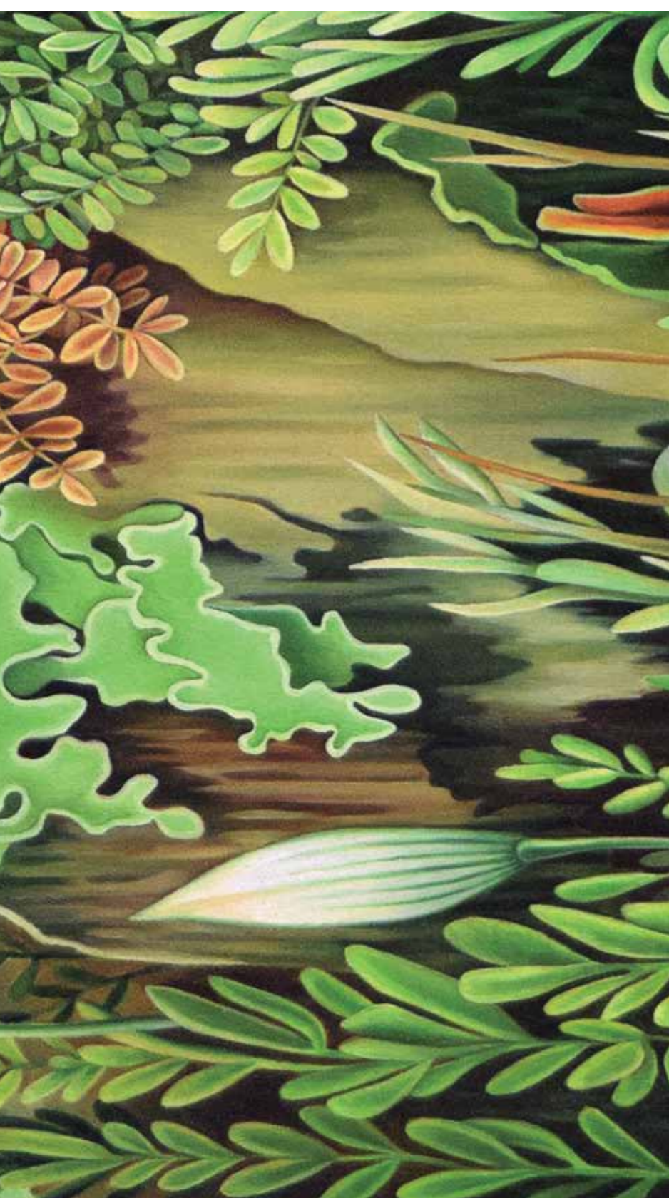
Después de todo, la pintura se ha de hacer como uno es.

lamiento de La Rioja a Joven Adquisición.