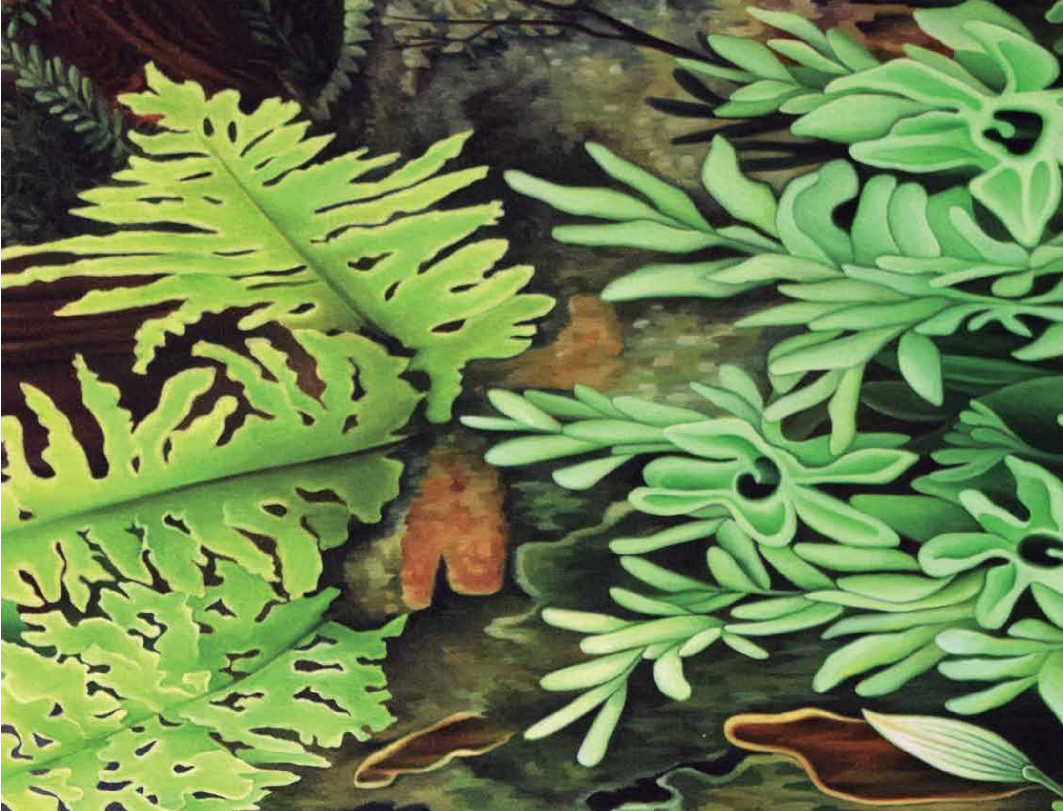
Azken batean, norbera den moduan egin behar da pintura.