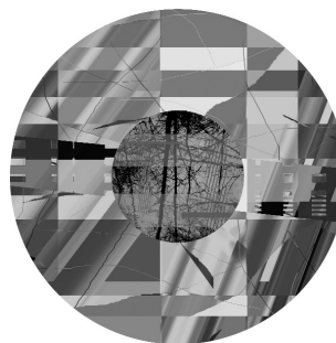
Ojos de agua. Ref. 270407, 2007

Adibidez, Ojos de agua sailean ( Ur begiak , 2007), argi-kutxetan estutzen du xafla metalikoz egindako gerriko batez organikotasunaren aztarna, kasu honetan ondoko ondoko kolore-planoen azpian irudikatutako argazkigintzako basotxo baten bidez irudikatutako organikotasuna. Alabaina, aldi berean, konposizio zirkular horiekin, badirudi margolariak aitortu nahi duela "begi-hondo hori" beti egon dela paisaiari begira.