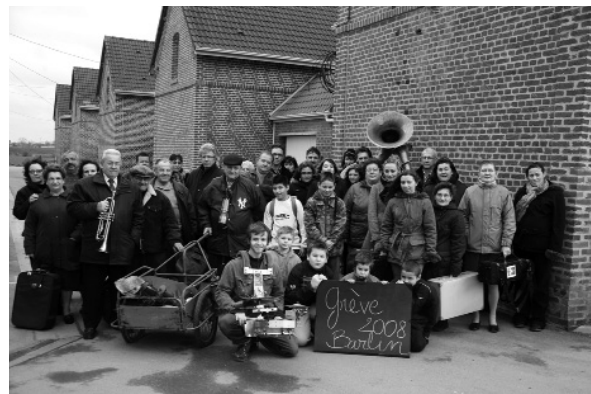
Bertille Bak, Faire le mur , 2008. Bideoa koloreetan, 17'7". Filmaketaren argazkia. Le Fresnoy studio national des arts contemporains-en ekoizpena. Collection Frac Aquitaine.

Bigarren atalak, Mendialdeko egunak izenekoak, gizakiak naturarekin duen harremana aztertzen du, gehienbat hiritarra den gizarte batean, oraingoan. Lehenik eta behin, Dove Alloucheren (Sarcelles, Frantzia, 1972) Melanophila II ou l'ennemi déclaré marrakzi-sailak denboraren ideia sartzen du espazio naturalaren pertzepzioan, eta aurrez aurre jartzen ditu gizakiaren orduak eta eritmo naturala. Bestalde, sua eta bere indar suntsitzailea aipatzen ditu; eta ideia hori Céleste Boursier-Mougenoten (Niza, Frantzia, 1961)