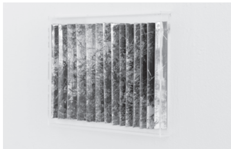
Ventanas a un imaginario II. Teknika mistoa. 19,5 x 29 x 2,5 cm

Hain zuzen, gardentasunak berak desagerrarazten du sortzen duen espazio bera, hau ireki eta hedatuz. Lanaren izenburuak bidera-