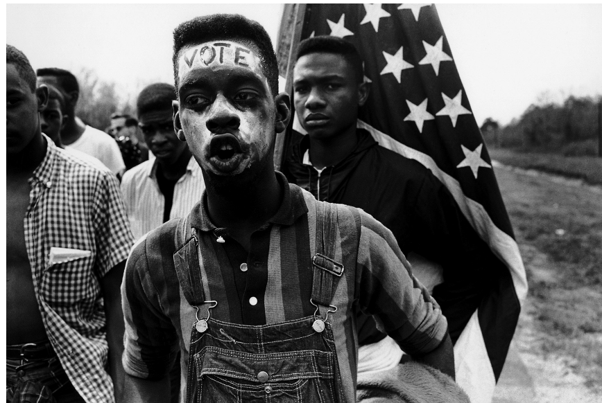
The Selma March, Alabama, 1965.