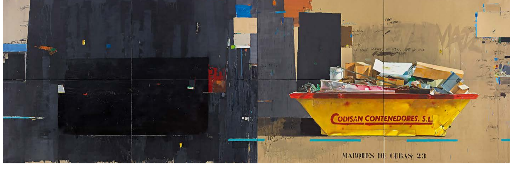
Marqués de Cubas 23, 2012-2015 Olio pintura oihalean, 280 x 780 cm

2012ko martxoaren 14an, 14:36an, Madrilgo Gran Vía, Atocha aldera paseatzen ari nintzela, Marqués de Cubas kaleko 23. zenbakian, edukiontzi hori bat ikusi nuen, eguzkiak eskuinetik ezkerrean zeihar jotzen zuela: nire argirik gogokoena eta ia nire obra osoan erabiltzen dudana. Argazki bat atera nuen, eta hurrengo egunetan edukiontzi bera ikusi nuen berriz, karga aldatuta, harik eta egun batean azaldu ez zen arte.