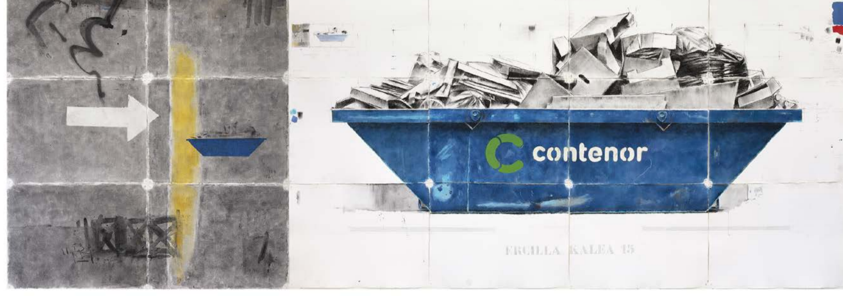
Ercilla kalea 15, 2022 Teknika mistoa, 173 x 460 cm

Azken urteotan, Quintana Martelok ardatz gisa hartu dituen margolanetan, artistak bisitatzeko hirietan aurkitzen dituen edukiontziak dira motiboa, abiapuntua eta aitzakia. Obra guztiek dute ezaugarri komun bat, arreta erakartzea lortzen duena: hasieran, eskulturaren presentzia zehatza, konposizio erakargarria eta inpaktu bisuala. Sailaren oinarria edukiontziak dira, eskultura-presentzia eta,aldi berean, hiriko bodegoi modura hartuta.