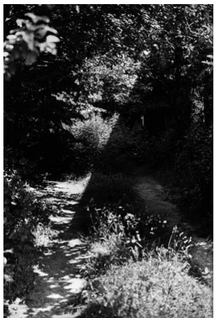
© Anne-Lise Broyer, Trezelan 2003 courtesy La Galerie Particulière, Paris

James George Frazer, La rama dorada , “El rey del bosque”, Cap. I, 1890.