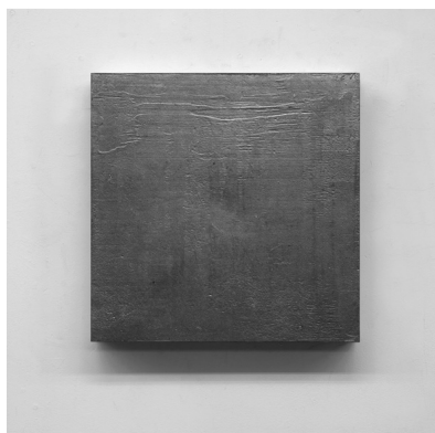
Serie Inflexiones , nº 12, 1996. Mármol y aluminio, 40 x 40 x 6 cm c/u. Vista frontal.

Inicialmente la obra de Jesús Pastor está ligada a las experiencias de la electrografía, a la búsqueda de las estructuras internas de las imágenes. Pero desde la mitad de los años 80 hasta entrados los 90, cuando utiliza como soporte mármol y aluminio, su obra adquiere una presencia y misterio especiales, de los que son ejemplo las obras seleccionadas en esta exposición de la serie Inflexiones , desde las formas cerradas sobre sí hasta las expansivas.